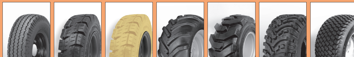
INDUSTRIAL FORKLIFT FORKLIFT ANTITRACCIA TRACTOR SKID ALL TRAC GARDEN